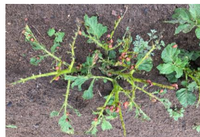
Des populations et des dégâts déjà très importants dans certaines parcelles ,CA58 12/06/23