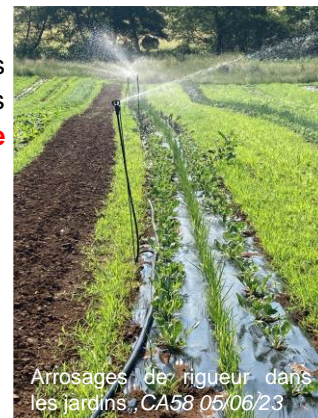
Arrosages de rigueur dans les jardins, CA58 05/06/23

De même, chaque irrigant doit être en mesure de pouvoir présenter son arrêté d'autorisation de prélèvement annuel lors d'un éventuel contrôle.