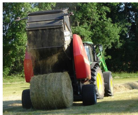
Chantier de pressage la semaine dernière

Données météo au 25 mai 2020