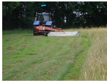
Depuis le week-end dernier la fauche des prairies a repris

Données météo au 10 mai 2020