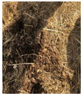
Plaquette de bois

Remarques: Les pailles de colza et de maïs présentent peu d'intérêt car elles sont moins absorbantes que les pailles "classiques". De plus, elles sont souvent pleines de poussières et de cailloux ce qui peut être préjudiciable à la santé et au confort des animaux.