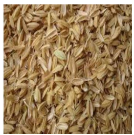
Balle de riz