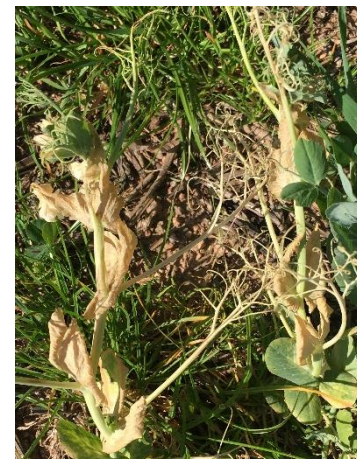
Conséquences du gel de mars dans un MCPI

Données météo au 12 avril 2020 (Source: Météo France)