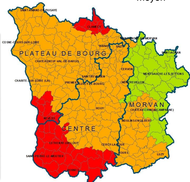
Données météo au 22 mars 2020