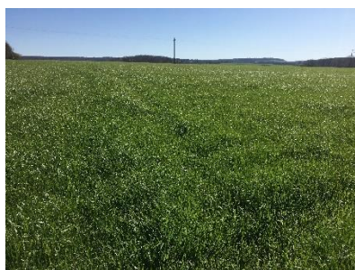
Ray-Grass d'Italie, photos prises le 30 mars 2021

Un fourrage récolté précocement (avant début épiaison) aura des bonnes valeurs en énergie et en azote, permettant de baisser la proportion de concentrés dans les rations ou d'utiliser ses fourrages pour des animaux à forts besoins (vaches en lactation, engraissement). Lorsqu'on s'approche de la fin montaison, les valeurs nutritives chutent fortement. Les observations faites ce début de semaine montrent des RGI déjà bien évolués → les récoltes devraient pouvoir débuter d'ici environ trois semaines pour une récolte avant la sortie des épis.