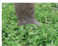
8 cm à l'herbomètre : Entre talon et cheville