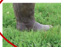
5 cm à l'herbomètre : Au talon