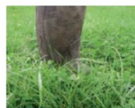
10 cm à l'herbomètre : A la cheville