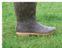
2 cm à l'herbomètre : À la semelle