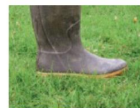
3 cm à l'herbomètre : Entre semelle et talon