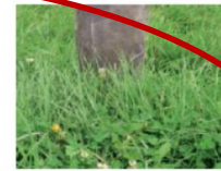
13 cm à l'herbomètre : Mi-botte

L'objectif est de faire pâturer en permanence une herbe située dans cette fourchette de hauteur : au-delà, on génère des refus (privilégier la fauche, en dessous, on risque de dégrader la prairie)