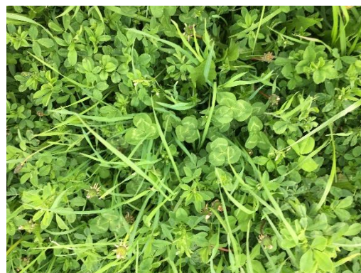
Mélange trèfle luzerne à Montsauche les Settons le 20/05/21. Photos CA 58

Données météo au 25 mai 2021 (Source : Météo France)