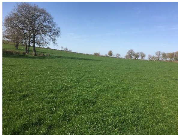
Les températures estivales de la semaine dernière ont donné un « coup de fouet » à la pousse d'herbe – Prairie permanente, photo du 1 er avril 2021, CA58

Données météo au 4 avril 2021 (Source : Météo France)