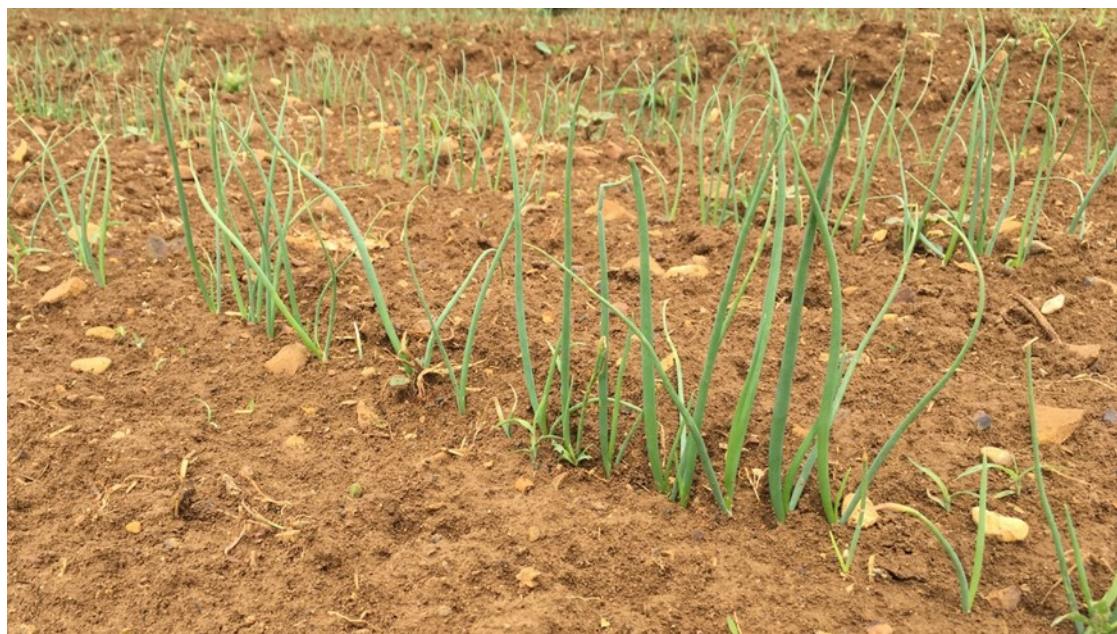
Oignons semés, Fenay, 28/05/2018, photo AL Galimard

Les oignons repiqués vont au stade 4 à 7 feuilles. Les oignons semés sont au stade 2/3 feuilles.