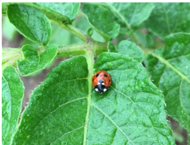
Auxonne, 28/05/2018

Des pucerons ailés sont observés dans 9 parcelles à une intensité faible. Par ailleurs, des coccinelles sont présentes dans 9 des 15 parcelles et peuvent permettre de limiter la pression des pucerons.