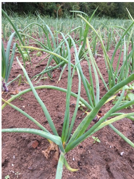
Auxonne, 28/05/2018