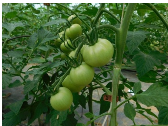
Tomates sous abris plantées semaine 14 et 15 (GY et SAINT-LAMAIN)