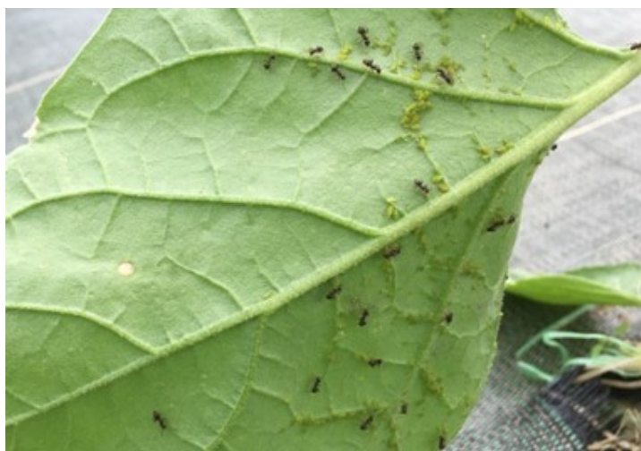
Aubergines sous abris avec pucerons et fourmis (FENAY)

Des départs de foyers sont observés dans 7 tunnels sur les 14 visités en relation également avec la présence de fourmis. Les populations sont peu développées mais doivent être contenues tôt pour éviter les développements importants, en particulier en agriculture biologique. Des lâchers d'auxiliaires ( Chrysopes , Aphidius ervi ...) sont réalisés dès la plantation et peuvent se poursuivre les semaines suivantes.