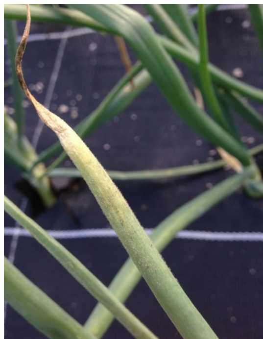
Grosbois, 28/05/2018

Mesures prophylactiques : le dépôt de tas d'oignons en bout de parcelle et les repousses sont des vecteurs importants de maladies, il est important de les éviter.