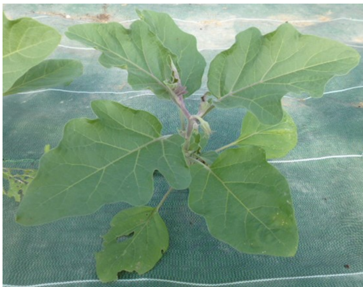
Aubergines sous abris, Flavine et Black Pearl, plantées les 10 et 19 avril (SAINT-LAMAIN et GY )