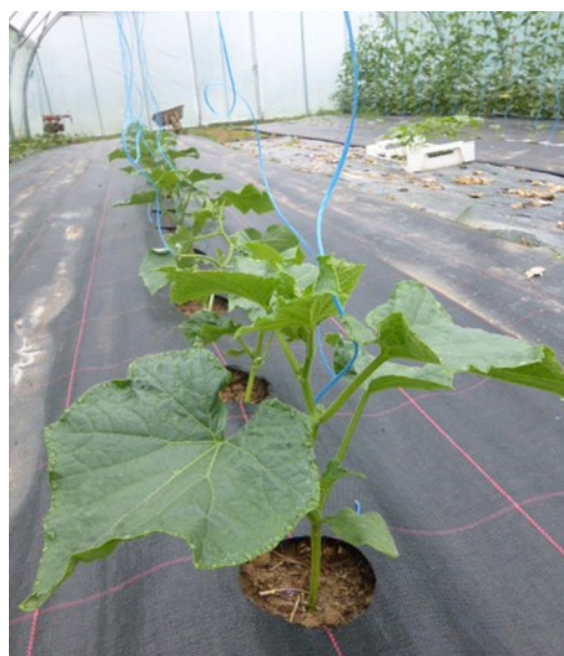
Concombres plantés semaine 19 (GROSBOIS et LES AUXONS)