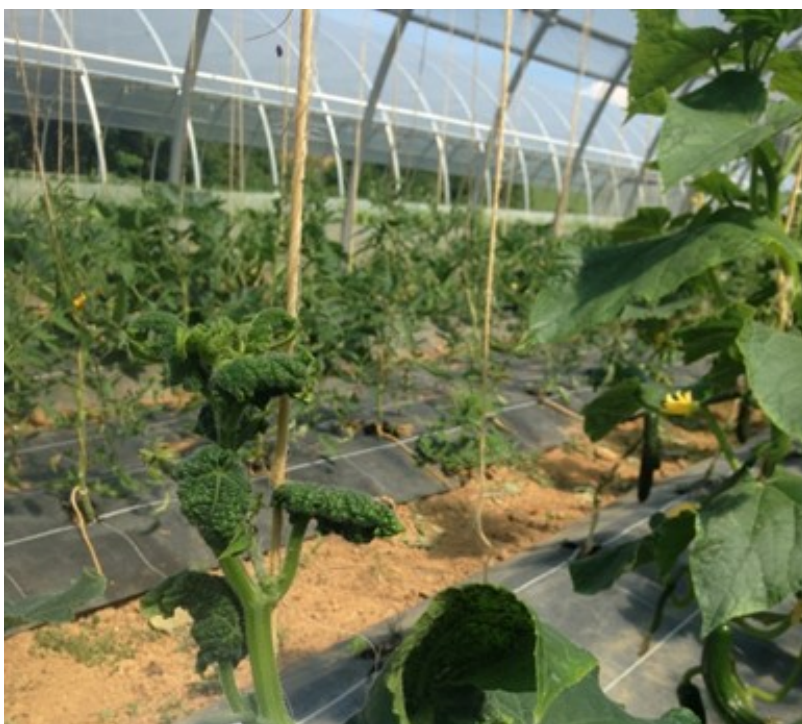
Attaques de pucerons sur concombres (GROSBOIS)

Les populations doivent être contenues tôt pour éviter les développements importants, en particulier en agriculture biologique. Des lâchers d'auxiliaires ( Aphidius ervi... ) sont réalisés dès la plantation et peuvent se poursuivre les semaines suivantes.