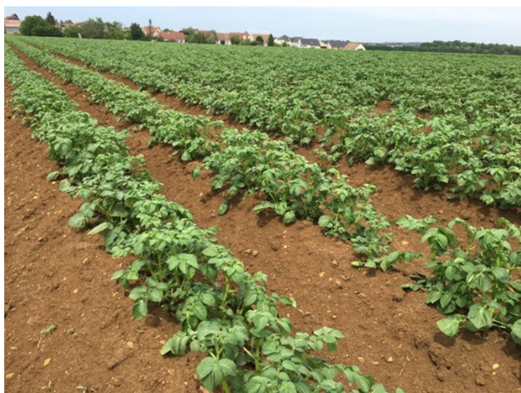
Fenay 28/05/2018, photo AL Galimard

1 parcelle n'est pas encore levée, pour les autres, les rangs se ferment et la tubérisation des parcelles les plus précoces atteint 40%.