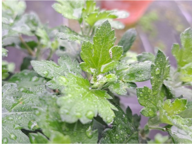
Cicadelles observées sur Chrysanthèmes multifleurs sans dégâts apparents.

Des cicadelles sont observées, sans provoquer de dégâts.