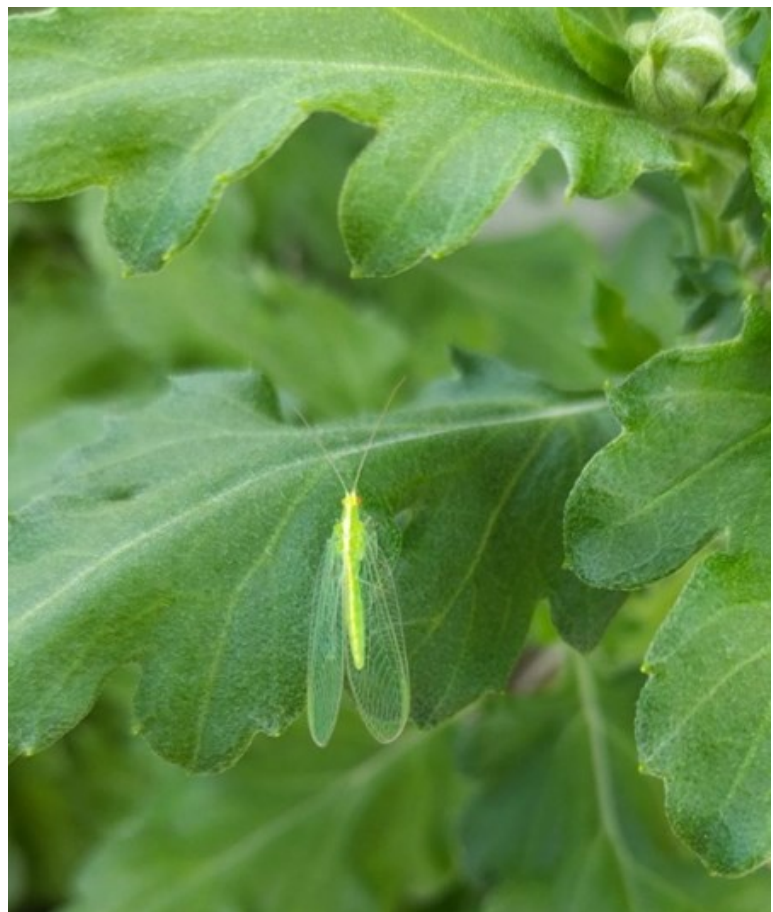
Adulte de chrysope