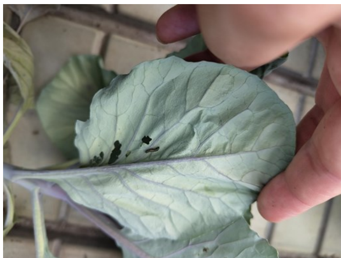
Dégât et individu sur choux

Localement on peut observer d'importants dégâts de chenilles défoliatrices sur choux ornementaux.