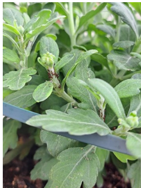
Grappe de Macrosiphoniella samborni observée sur chrysanthèmes multi fleurs

Des foyers de Macrosiphoniella samborni sont observés.