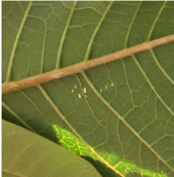
Petit foyer d'aleurodes sur poinsettia

Des foyers sont observés dans les cultures. Il est primordial de continuer les lâchers d'auxiliaires pour contenir les populations (de stades jeunes).