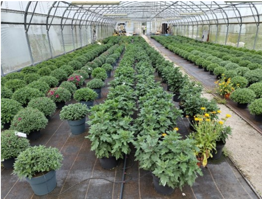
Soucis utilisés en plante de service pour les auxiliaires