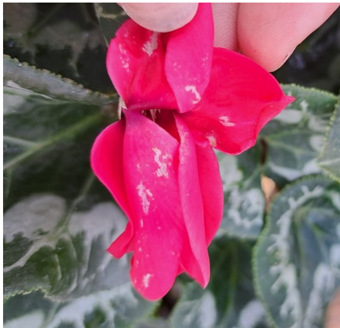
Dégâts de Thrips sur fleurs de Cyclamens

Des thrips (surtout du Thrips setosus ) sont observés dans les cyclamens. Ils provoquent des crispations des feuilles, des avortements des boutons floraux et des tâches sur fleurs.