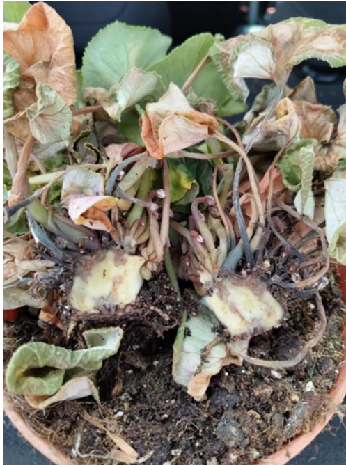
Dégâts sur tubercule

D'importants dégâts de bactérie (Genre Erwinia) sont à noter localement, sur la culture de cyclamen. Il n'existe aucune solution à part le tri des pots et les bonnes pratiques culturales (irrigation, fertilisation, climat).