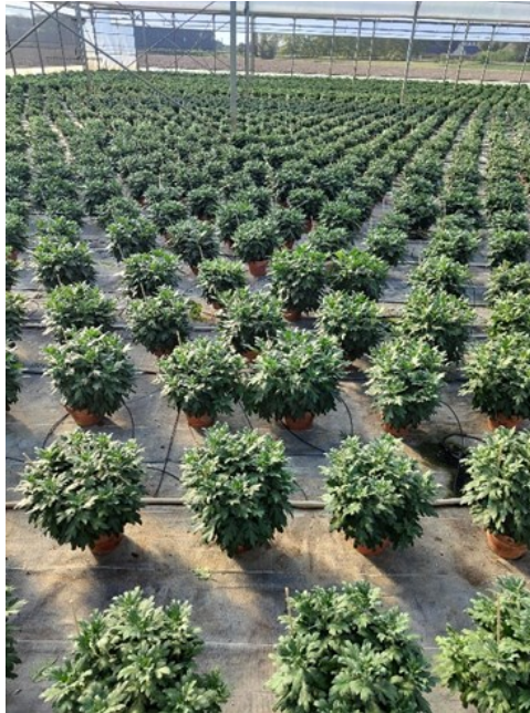
Culture de chrysanthème grosses fleurs