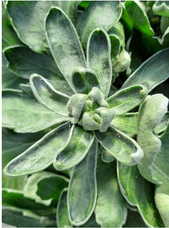
Foyer d'acariens observés sur Chrysanthème GF.

Attention à la dissémination de ces ravageurs, surtout en période d'éboutonnage des grosses fleurs !