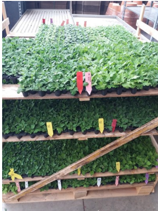
Réception des plants de chrysanthèmes

Les repiquages ont commencé, pas de problème particulier.