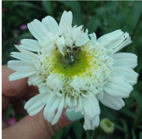
Dégâts et présence de chenille dans fleur