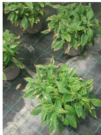
Symptômes sur pentas