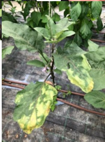
Photo aubergine, le 31 mars et le 08 juin

On peut avoir des plants atrophiés qui ne produiront pas ou peu.