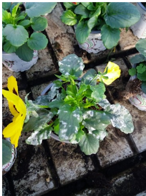
Oïdium face supérieure de la feuille sur pensée