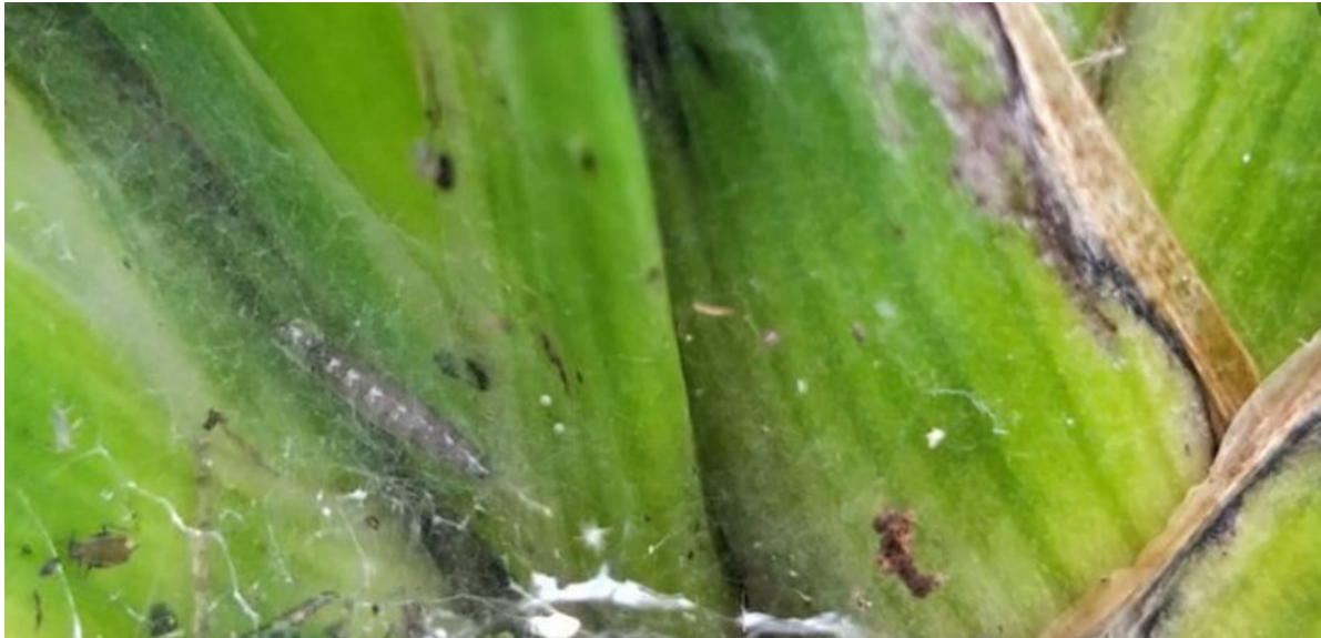
Chenille de Duponchelia dans sa toile

En cas d'attaque, il faut appeler votre conseiller, des solutions alternatives au traitement chimique sont expérimentées !