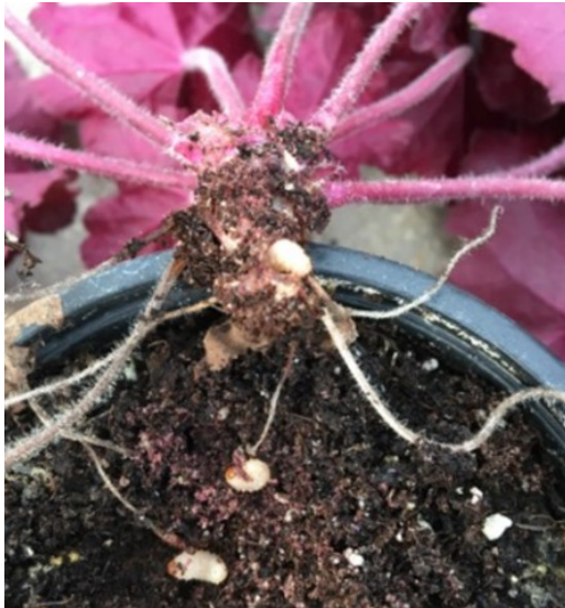
Trois larves d'otiorhynque à la base de la plante

Surveillez les larves d'otiorhynques sur toutes ces cultures !