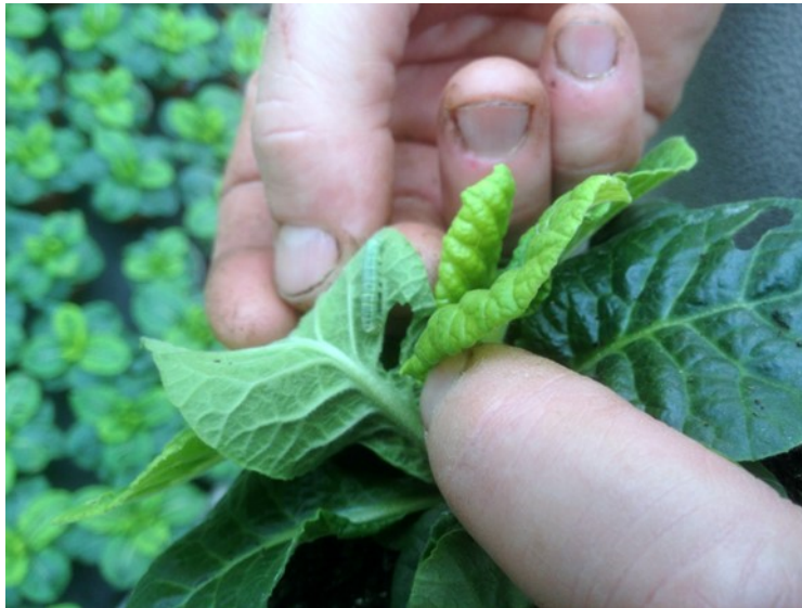
Chenilles qui se confondent avec la feuille, sur primevères