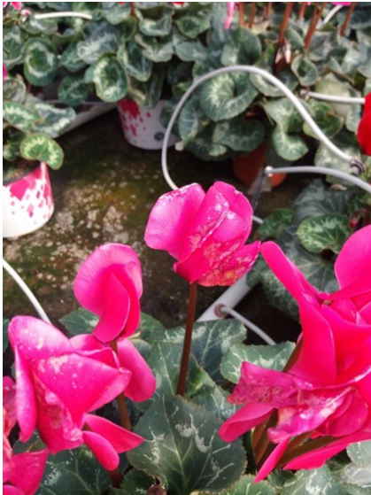
Symptômes de botrytis sur fleurs de cyclamen