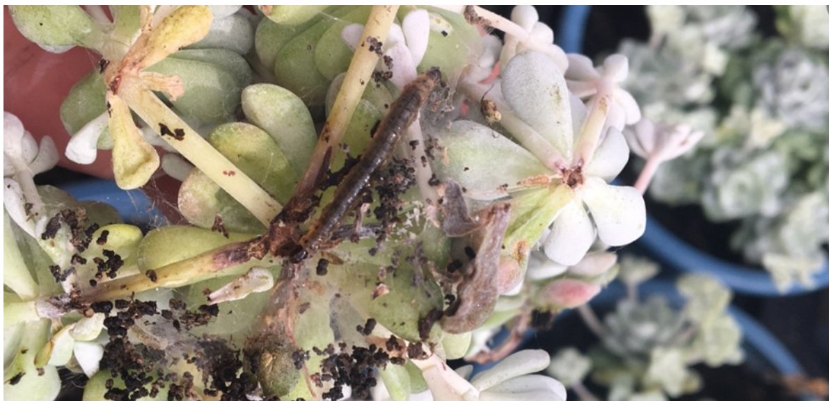
Chenille de Duponchelia sur sedum