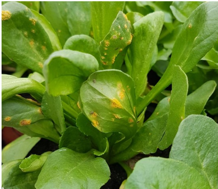
Points de rouille sur pâquerette

On a observé les premières attaques sur des séries de 8 à 10 semaines.