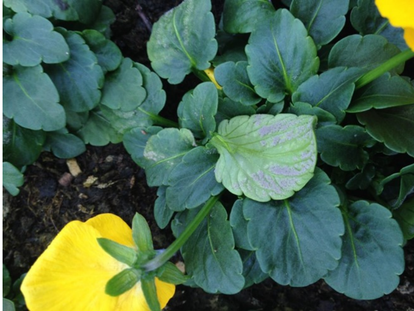
Mildiou : Feutrage violet sous les feuilles, la face supérieure devient jaune

Il faut ventiler les serres la journée et distancer vos plantes pour assurer une bonne circulation de l'air entre les pots.