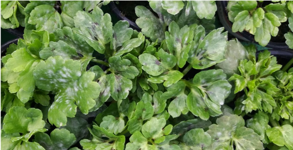
Premières attaques d'oïdium sur renoncules

En cas d'attaque, il faut appeler votre conseiller, des solutions alternatives au traitement chimique sont expérimentées !