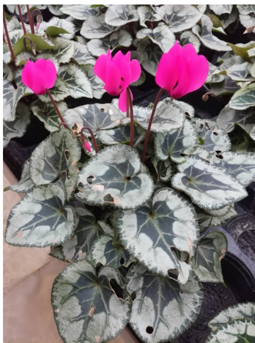
Dégâts de chenille sur feuille de cyclamen

Localement, toujours des dégâts de chenilles et quelques thrips dont le thrips setosus !