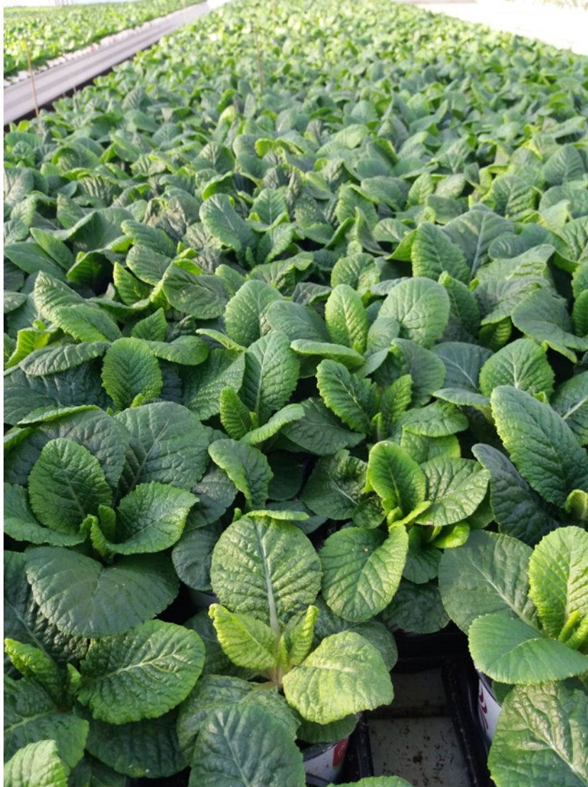
Culture de primevères

Les cultures sont en place, certaines commencent à être distancées !