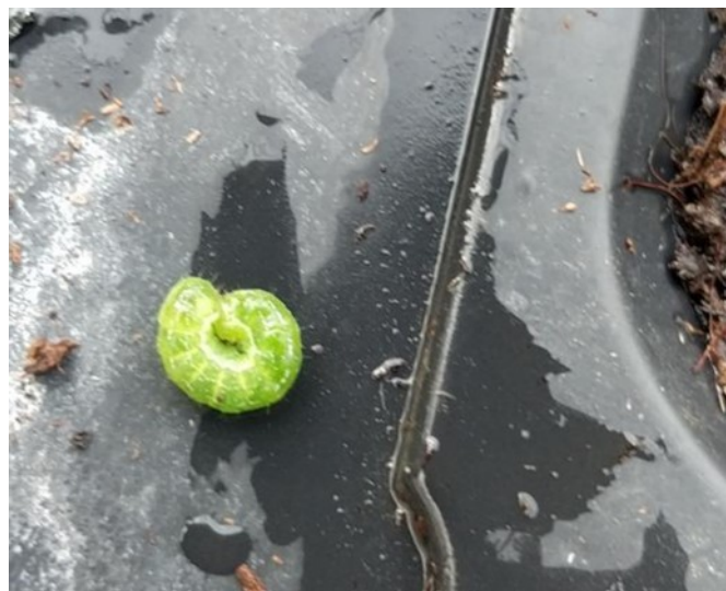
Chenille sur cyclamen