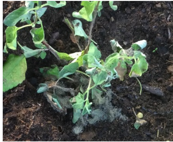
Botrytis sur sauge vivace