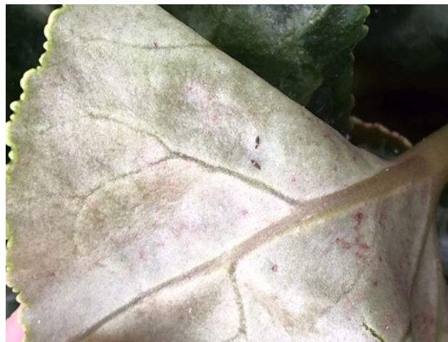
Adulte de Thrips setosus

Identifié en Franche-Comté pour la première fois en 2019, il ne cesse de gagner du terrain. Exclusivement retrouvé sous serre, le Thrips setosus est un « gros » thrips noir (l'adulte mesure 1,3mm), avec une partie blanche en haut de ses ailes. On le retrouve notamment sur solanacées, chrysanthèmes, hosta, hydrangeas, impatiens, cyclamens et poinsettias.