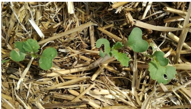
Dégâts de limaces, E. Joudelat (CA89)

Hors réseau, des limaces grises sont signalés dans des parcelles en Agriculture de Conservation des Sols.