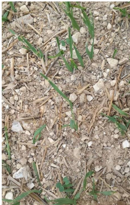
Repousses d'escourgeon dans colza en cours de levée, E. Joudelat (CA89)