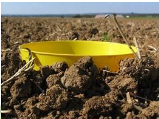
L. Jung, Terres Inovia

On enterre la cuvette dans le sol pour favoriser les captures à l'occasion de ses sauts (piège d'interception). Les altises doivent pouvoir tomber dans le piège au fil de leur avancée dans la parcelle.