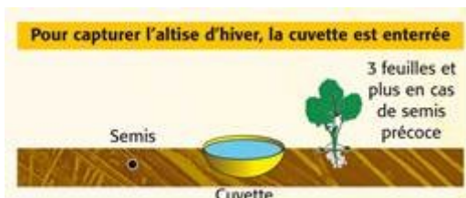
Cuvette enterrée (illustration Terres Inovia)

Elles se placent au niveau de la végétation sauf pour les grosses altises (altises d'hiver) ou la cuvette doit être enterrée.