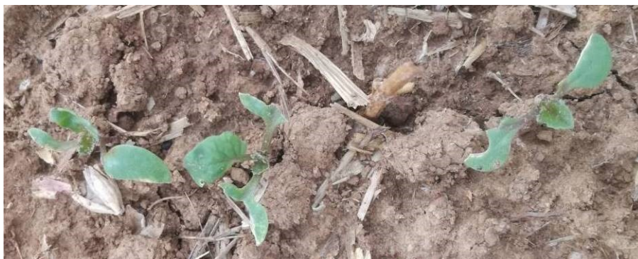
Dégâts d'oiseaux, E. Joudelat (CA89)

Il convient de ne pas les confondre avec des limaces (feuilles déchiquetées, absence de bave).