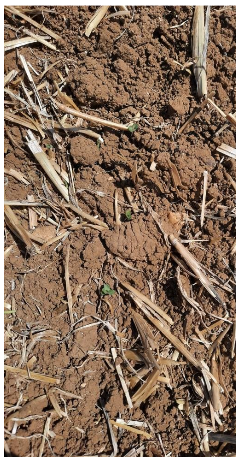
Levées plus ou moins homogènes (une dizaine de mm depuis le semis), S. Joud (CA39)