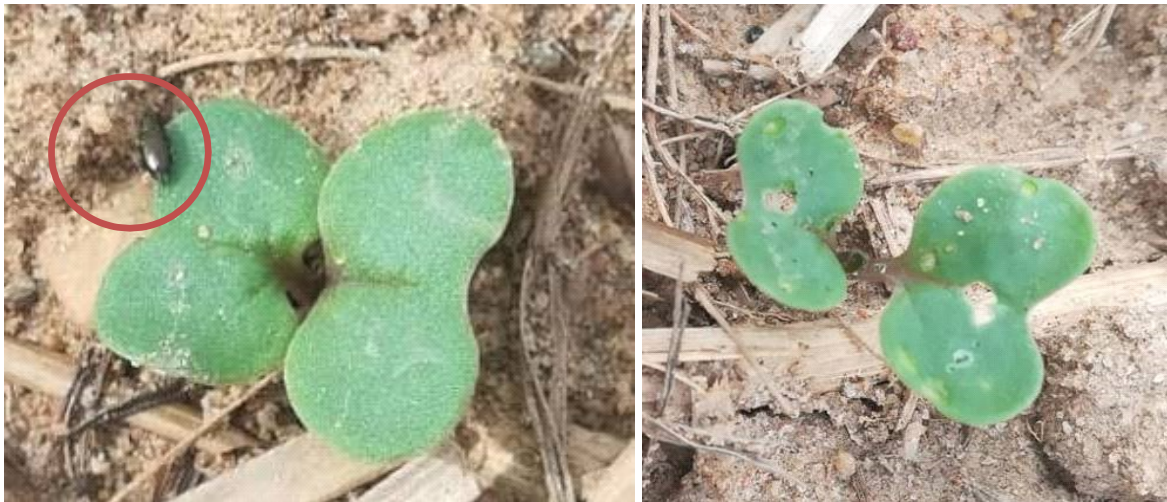
Petite altise sur colza à cotylédons et morsures

Aucune capture n'est signalée en cuvette. Quelques petites altises peuvent être visibles sur la végétation.