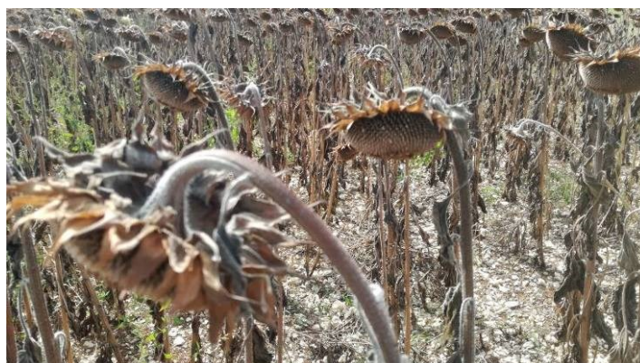
Tournesol en sol séchant, E. Joudelat (CA89)

Des dégâts d'oiseaux (pigeons) sont observés, notamment dans les parcelles en sur-maturité.