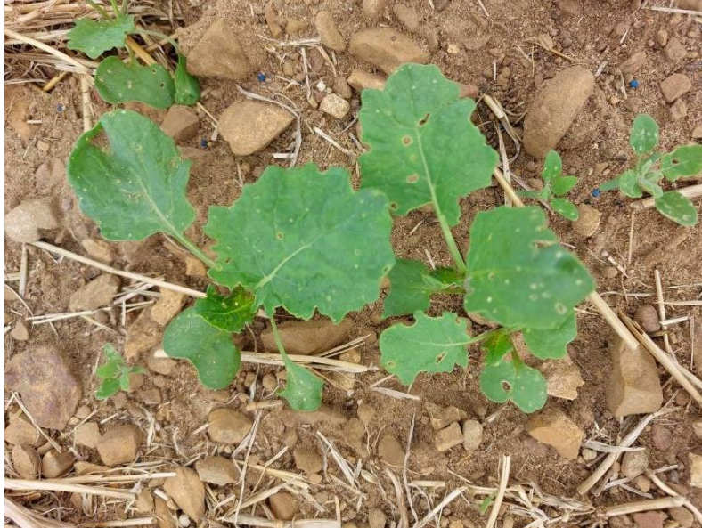
Colza stade 4 feuilles, semis de août irrigué (et levée de chénopodes)

De façon anecdotique, quelques parcelles dépassent déjà le stade 4 feuilles (semis à partir du 20 juillet).