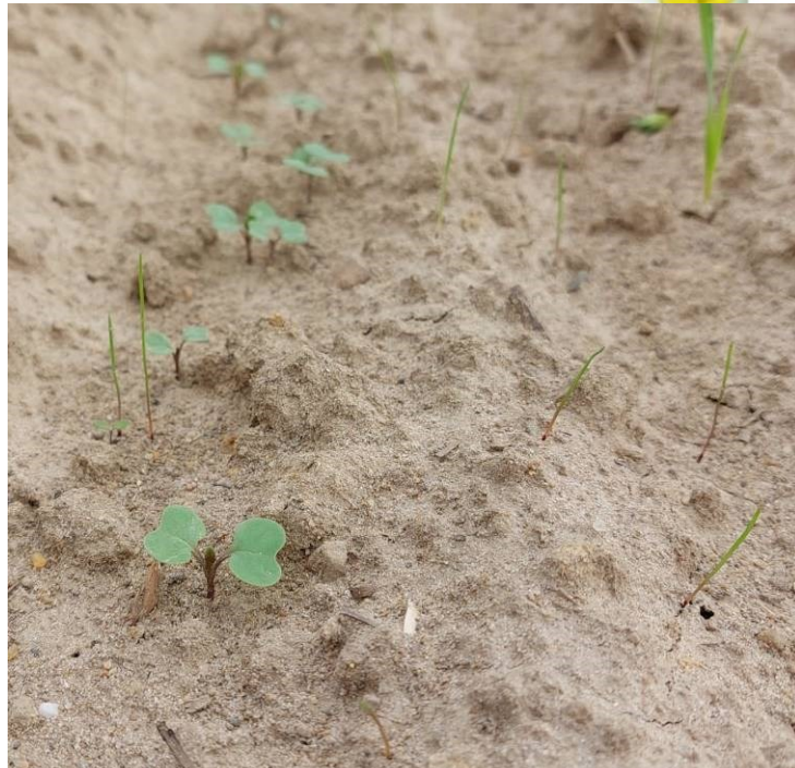
Levée de graminées, Y. Marin (CA58)