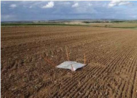
Pièges à limaces (Terres Inovia)

Avant la levée de la culture, l'observation des limaces grises et noires se fait à l'aide de 4 pièges de 25x25 cm préalablement humidifiés par trempage, éloignés d'au moins 5m les uns des autres.