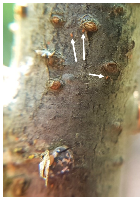
Des larves mobiles sont présentes sur l'écorce (fléchées en blanc). Sous les boucliers, des œufs vides et des œufs encore pleins sont visibles. Photo du 13/08