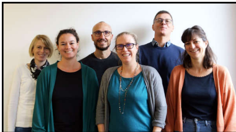
L'équipe du S ervice A limentation, F ilière, I nnovation et Q ualité

Le service SAFIQ, grâce à l'investissement de ses 4 conseillers et son assistante, axe ses interventions sur la réponse aux besoins alimentaires du territoire et à l'innovation par les actions ayant pour objectif de :