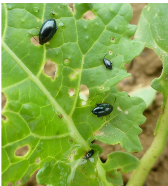
Authume, TNT : Présence altises et surface foliaire détruite élevée.

On retiendra aussi que la pyréthrianoïde utilisée soit de la betacyfluthrine (DUCAT 0.3 l/ha) est encore efficace sur altises.