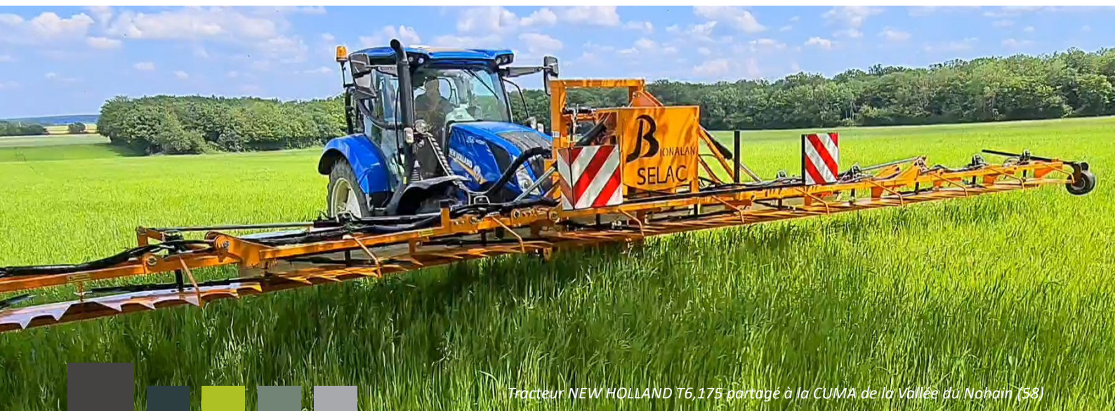
Tracteur NEW HOLLAND T6, 175 partagé à la CUMA de la Vallée du Nohain (58)

« L'environnement de nos exploitations change. Cette année dans un contexte de forte augmentation des prix, nous venons de renouveler nos 4 tracteurs avec pour objectif de tenir un coût de l'heure qui reste correct. Nous avons opté pour un contrat d'entretien. Peut-être que 3 tracteurs seraient suffisants ? Qu'ils pourraient être davantage optimisés avec un salarié ? Ce renouvellement est un engagement dans la CUMA ; il nous donne une visibilité sur 4 ans ».