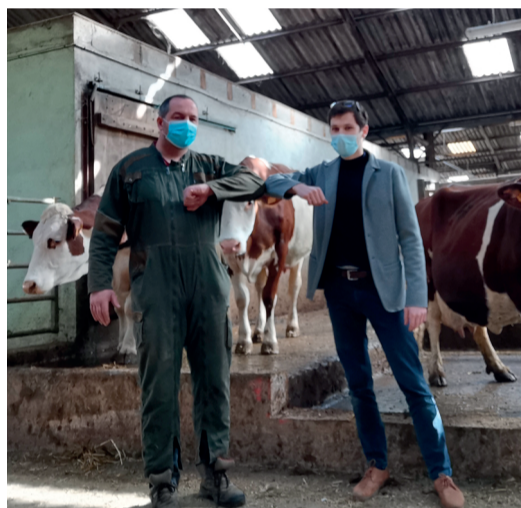
Messieurs Vignon et Écoiffier marquent leur partenariat.

L'OP Jura Bresse est systématiquement pionnière dans de nombreux projets chez Danone. Ils ont à cœur de s'adapter aux attentes des consommateurs, leur président est actif et a une sensibilité commerciale. Il est rare que les projets avancent aussi vite et de façon aussi massive. Un indicateur le prouve : le projet a été lancé en mars-avril 2021. Notre objectif était d'atteindre 100 % d'engagement en 2023. À la mi-mai 2021, 85 % des éleveurs de l'OP ont indiqué qu'ils signeraient fin 2021 . Notre objectif sera atteint un an plus tôt, en 2022. Nous avons vocation de le déployer dans d'autres OP. C'est pour nous le symbole d'un projet de filière structuré avec les acteurs locaux, dans une dynamique collective ».