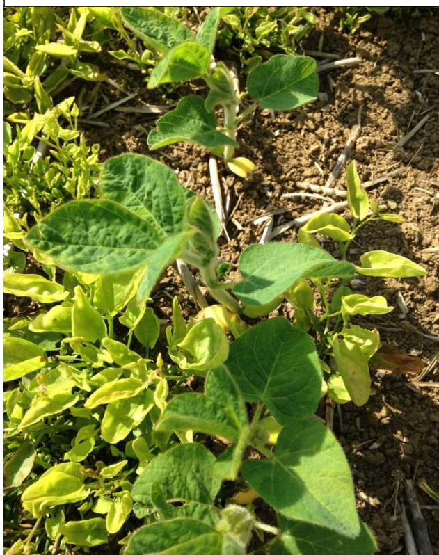
Liseron après application Pulsar+ Basagran

* Désherbage : la première feuille trifoliée est présente sur les sojas les plus précoces. Les désherbages de post-levée ont débuté notamment avec des applications fractionnées de Pulsar associé ou non au Basagran SG/Adagio SG généralement plus efficaces que des applications uniques. Cette association est recommandée notamment en présence de laiteron, séneçon et matricaire. Cependant, attention à l'utilisation de la « bentazone », cette substance active peut poser des problèmes dans certain captage au point d'être interdite d'emploi.