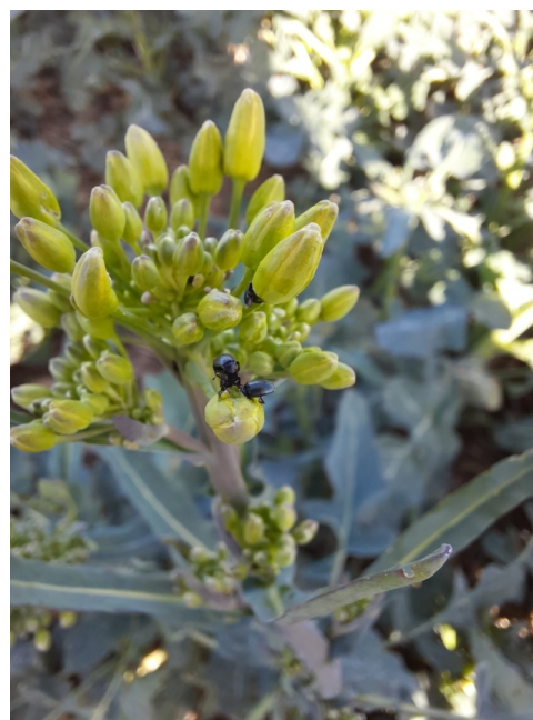
Photo n° 1 : méligèthe en pleine action à Malange 72 heures après un traitement insecticide "Trebon 0.2 l/ha"

Le nombre de méligèthes par plante se situe aux environs de 8 par plante à Ruffey sur Seille, Bletterans et Asnans-Beauvoisin et 11 à Augerans. Pour cette dernière, des dégâts sont observés, le traitement insecticide est inévitable. À l'inverse, elles restent très faibles sur le Finage (Saint-Aubin, Annoire, Petit-Noir) avec moins de 0,5 méligèthe par pied. On constate donc des différences entre secteur qui depuis quelques années déjà, font que certains ne traitent plus quand pour d'autres 1 voire 2 traitements sont nécessaires.