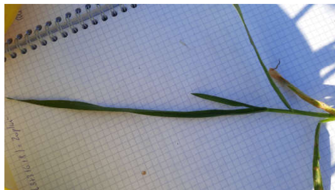
Photo 2 : F1 déployée du moment d'une longueur excessive ou anormalement longue sur KWS Ultim (15 à 20 cm).

Début tallage à « épi 1 cm » selon variété et date de semis.