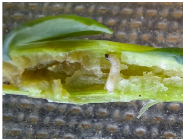
Photo 1 : au champ, les larves sont bien visibles et leur quantité impressionne parfois.