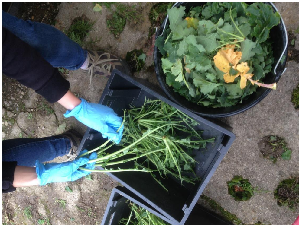
Préparation des pieds de colza pour Berlèse

La campagne touche à sa fin. On a l'espoir d'avoir une colonne vierge dans le prochain relevé hebdomadaire à propos du charançon du bourgeon terminal et pourquoi pas des grosses altises. Ce qui n'empêche pas la réalisation des berlèses. Une dizaine est en cours de réalisation à la Chambre d'Agriculture du Jura et le nombre devrait s'intensifier prochainement. Nous communiquerons ultérieurement les résultats, sachant qu'il faut 2 à 4 semaines avant d'avoir le résultat définitif.