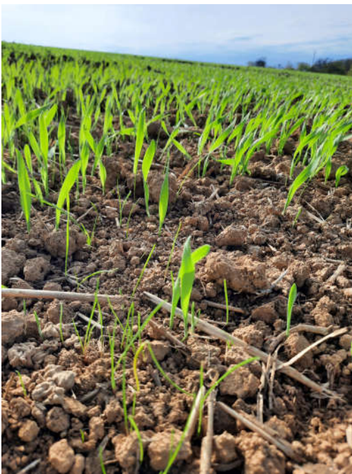
Photo 3 : Authume, belle levée d'une orge d'hiver mais aussi du vulpin

Beaucoup de parcelles sont bien levées mais on ne voit pas toujours que la céréale semée. Les graminées peuvent être présentes et en nombre (voir Photo 3).