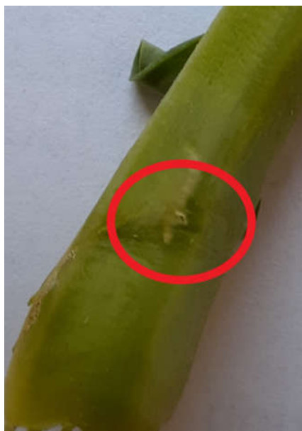
Photo 2 : Saint-Loup, galerie d'altise et trou de sortie de la larve.

Sur le terrain : toutes les parcelles sont concernées par des captures, mais la quantité totale est deux fois moindre que la semaine précédente (voir Tableau 2). Pour l'instant les pétioles sont sains, on voit rarement les traces de larves d'altises ou ces dernières (voir Photo 2). Les petits colzas de l'ordre du gramme poussent laborieusement mais poussent tout de même. Une protection insecticide vis-à-vis de la grosse altise est inutile contrairement à celle visant le CBT. C'est peut-être une pluie conséquente qui pourrait lui être le plus bénéfique.