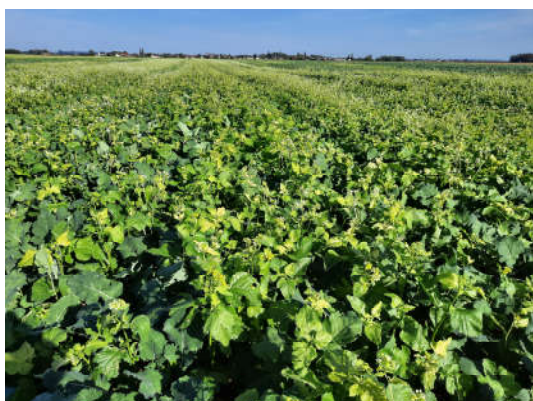
Photo 1 : Qui a dit qu'il n'y avait plus de moutarde dans les rayons ? Ce n'est pas le cas à Annoire chez Sébastien