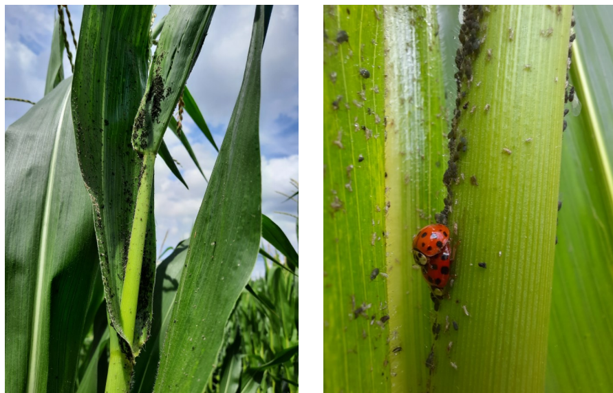
Photo 2 et 3 : à gauche pullulation de "rhopalo", à droite coccinelles en mode reproduction au milieu des "rhopalo"

Le choix de produit autorisé est limité, Karaté technologie zéon (lambda-cyhalothrine) à la dose de 0,075 L/ha et Karate K (pyrimicarbe + lambda-cyhalothrine) à la dose de 1,25 L/ha. Nous déconseillons d'intervenir avec le premier produit moins efficace et qui peut favoriser de nouveau les pucerons du fait de son effet sur la faune auxiliaire. Seul le deuxième présente une bonne efficacité.