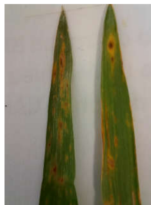
Photo 1 : Taches physiologiques et non septoriose sur F3 de la variété Chevignon.

Envisagez un traitement systémique dès que la dernière feuille est complètement déployée. Voir liste de produits et dose selon nuisibilité des