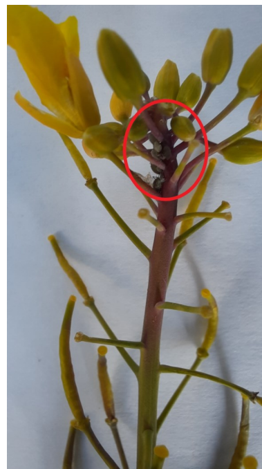
Photos 1 et 2 : Au début de la colonisation, extrémité de la tige violette, quelques pucerons, puis 2-3 semaines plus tard à Annoire

Rappel : Il n'existe pas véritablement de seuil de traitement mais à partir d'une colonie (petite ou grosse) tous les 10 mètres linéaires, il faut envisager un traitement insecticide. Mais c'est surtout la vitesse d'évolution qu'il faut prendre en considération. Si au bout de 3-4 jours ou plus, ça progresse, il faut intervenir. Les simples « pyrèthrinoides » ne sont pas efficaces. Utiliser un insecticide à base de pyrimicarbe. Seuls 3 produits sont